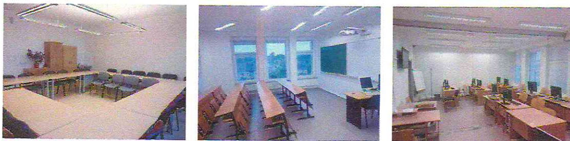
5 pav. Patalpos Studentų g. 56, Kaune

Įgyvendinant šią veiklą buvo atliktas pastatų 1C5b ir 2C1p Studentų g. 56, Kaune paprastasis remontas: suremontuotos mokomosios auditorijos, kompiuterinės klasės, metodiniai kabinetai, katedrų darbuotojų darbo kabinetai, pasitarimų patalpos, administracinės patalpos, įrengiamos studentų savarankiško darbo zonos. Remonto metu pakeista (atnaujinta) grindų danga, perdažytos sienos ir lubos, atnaujinta apšvietimo sistema, pakeista elektros instaliacija, atnaujinti sanitariniai prietaisai (žr. 5 pav.). Remonto metu buvo atnaujinta 1 911 kv. m ploto. Atnaujintos auditorijos ir darbo kabinetai, iš viso 124 patalpos. Ataskaitiniu laikotarpiu atlikta darbų už 477 379,91 Eur. Į suremontuotas patalpas perkelti padaliniai iš A. Mickevičiaus g. 37, Gedimino g. 50 ir Kęstučio g. 27, Kaune esančių pastatų.