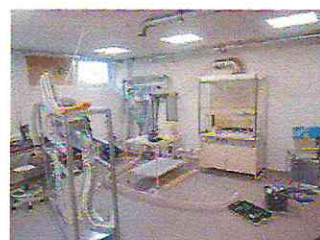
1 pav. Patalpos Radvilėnų pl. 19, Kaune