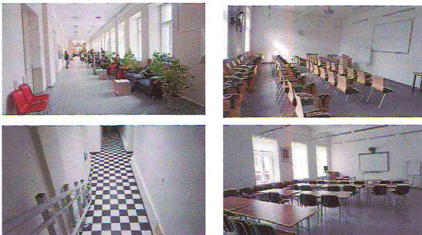
4 pav. Patalpos A. Mickevičiaus g. 37, Kaune