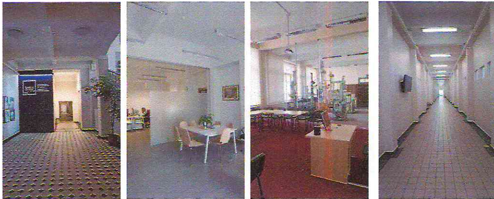
3 pav. Patalpos Gedimino g. 50, Kaune