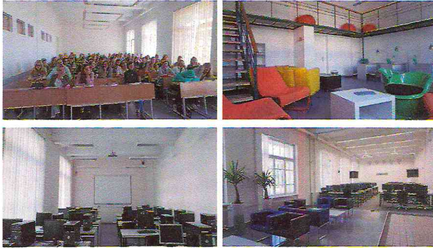
2 pav. Patalpos Gedimino g. 50, Kaune

521 882,27 Eur) bendra atlikta darbų suma – 1 118 549,69 Eur. Remonto metu buvo atnaujinta 3 328 kv. m ploto. Visiškai atnaujintos auditorijos ir darbo kabinetai, iš viso 115 patalpų, į suremontuotas patalpas perkelti padaliniai iš Gedimino g. 43, Laivės al. 55, Kęstučio g. 8, Kaune esančiu pastatų.